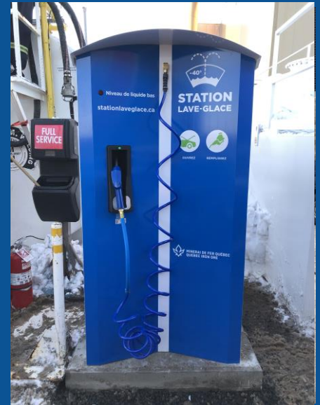
Minerai Fer QC